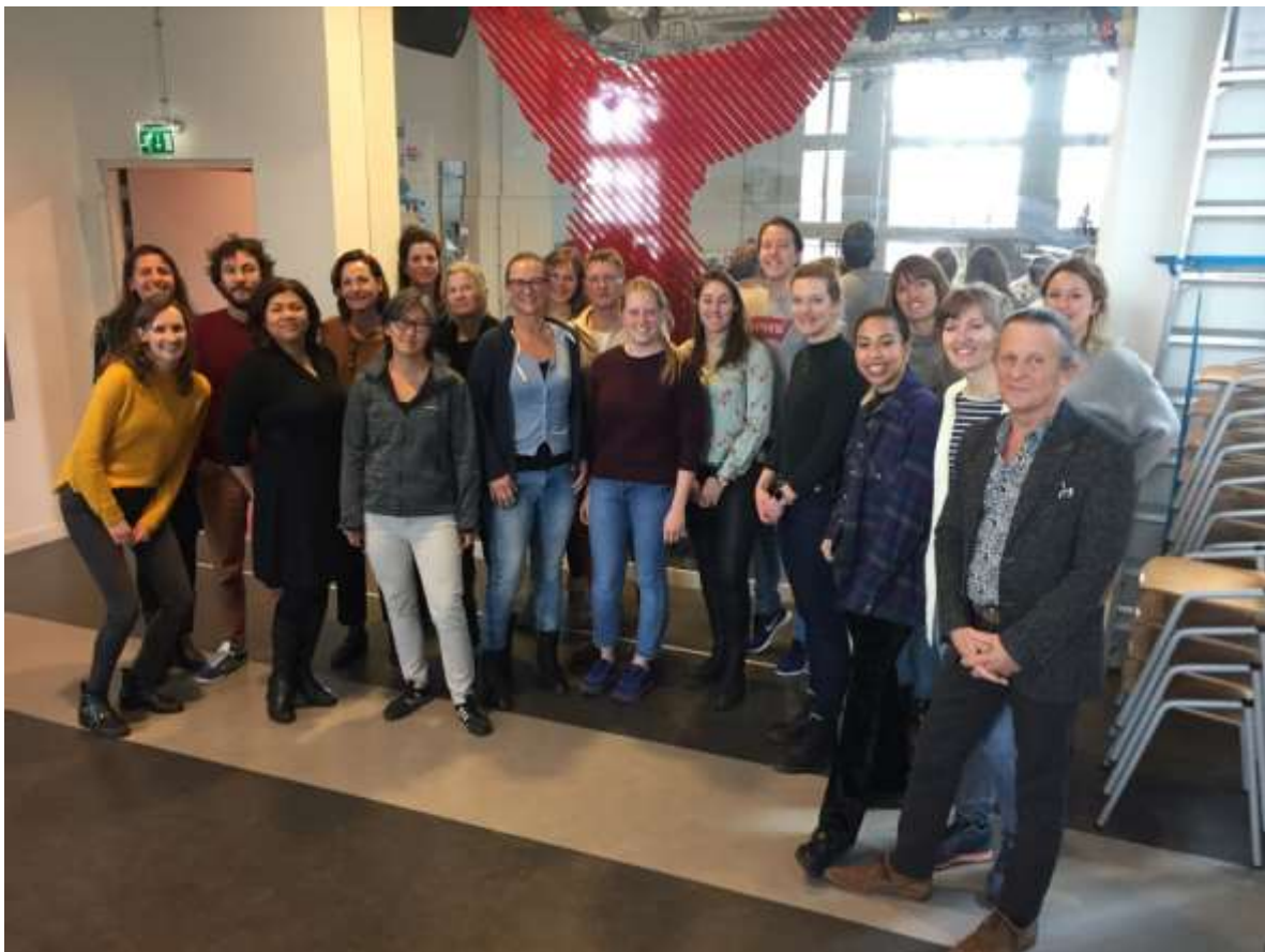
Niet alle platformleden staan vertegenwoordigd op deze foto.

N.B. de ZonMw-projectperiode van alle proeftuinen (1 e en 2 e tranche) loopt per 1 maart 2020 ten einde.